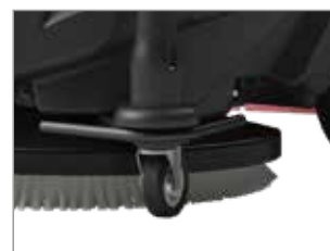
ROUE DE TRANSPORT BREVETÉE