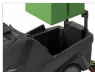
EMPLACEMENT LARGE POUR LA BATTERIE