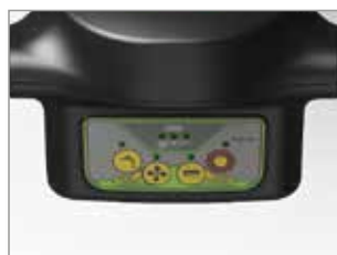
PROGRAMMES DE TRAVAIL PRÉDÉFINIS