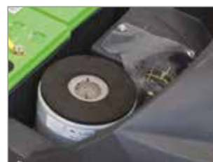
MOTEUR D'ASPIRATION 3 ÉTAGES